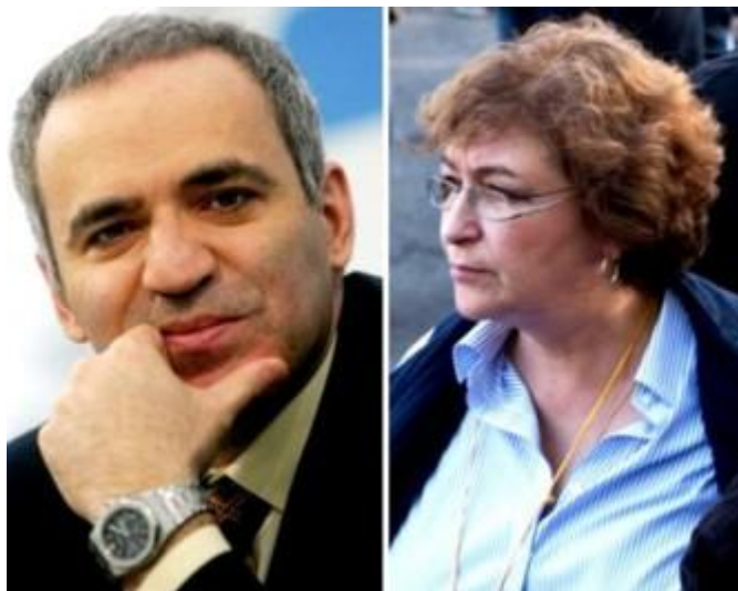
Г.Каспаров и Е.Альбац

Четыре года назад в Интернете вели свою пропаганду 800 откровенно юдофобских сайтов, а сегодня их количество перевалило за тысячу.